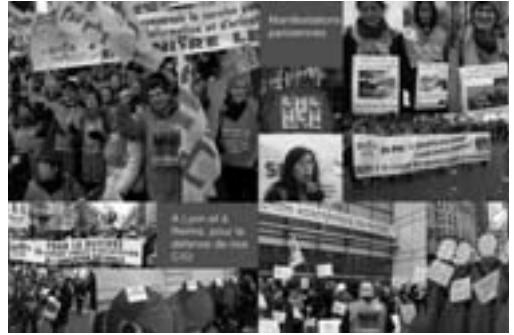
Combats au quotidien

► L'arrêté définissant les modalités et le contenu de formation , présenté en CTM le 16 novembre, ne contenait rien des garanties que la FSU attend sur les horaires, les contenus, les modalités pratiques de la formation. La FSU intervient pour que la DGSIP (1) respecte la note de cadrage actée par le cabinet le 20/07/2016. Les arguments avancés sont d'ordre financier. Pourtant, comment, à budgets constants, les crédits alloués pour deux ans de formation de CO-Psy stagiaires et un an de préparation au DEPS